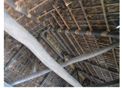
旧小川家の内側からみた屋根