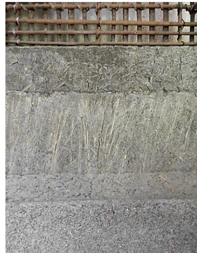
Estructura de la Tsuchi kabe

Las paredes de la casa están hechas de tierra. Estas paredes se llaman "Tsuchi kabe". Sin embargo, en lugar de tierra común, se aplica una mezcla de tierra y paja a un armazón de bambú y luego se aplica otro tipo de tierra encima para que la pared sea resistente al agua y la lluvia.