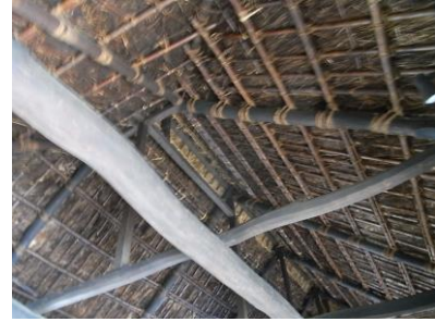
El techo visto desde el interior de la Antigua casa de la familia Ogawa

Si observa el techo de la Antigua casa de la familia Ogawa por dentro, podrá ver cómo está construido.