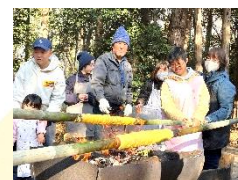
バウムクーヘンを作ろう