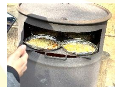
まきでピザを焼こう